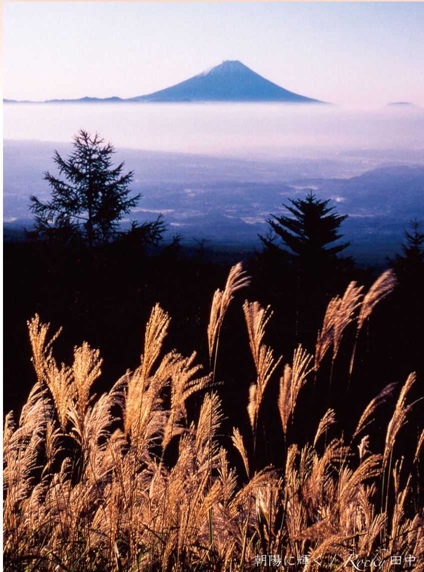
朝陽に輝く / Rocky 田中

甲府盆地を覆っている雲海の上。 朝陽を待ちかねたススキが 一斉にカンタータを歌った。